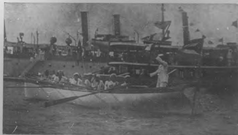
Festajeando el 10 de Octubre.—Bote del crucero "Cuba" ganador de la regata á diez remos.

A fines del corriente mes tendremos la compañía de opereta italiana, en la que figura la Gatini como tipo, tan conocida y apreciada por nuestro público.