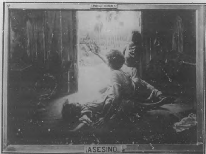
IASESINO!—Cuadro de Santiago Quiñones.