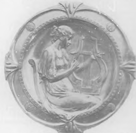
Grat. plato de plata repujada, regalo de BOHEMIA ofrecido al poeta premiado.

El plazo para la admisión de composiciones vence como dijimos en el número anterior, en 10 de noviembre.