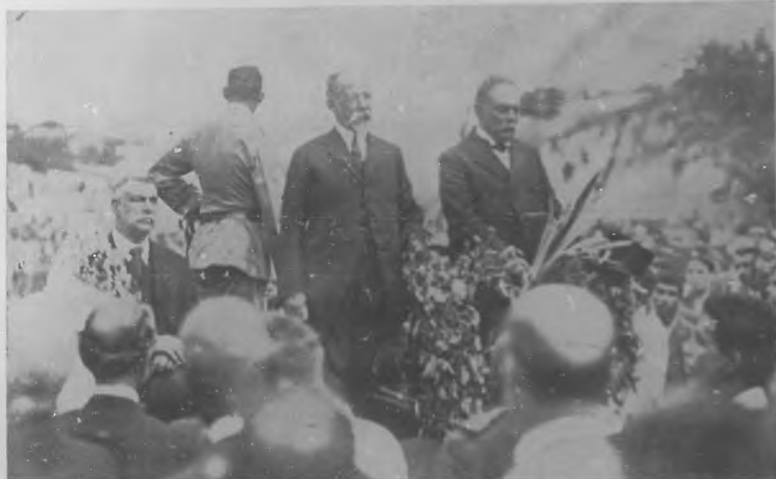
Comemorando el 10 de Octubre.—Los Emigrados Revolucionarios en el "Foso de los laureles".

El decorado, de José Yomiz, magnífico, la presentación lujosa. Hay guignol para una temporada.