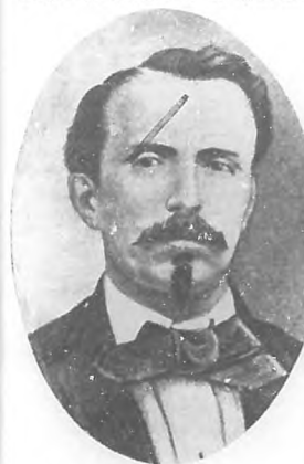
Carlos Manuel de Céspedes

Al conmemorar el 44º aniversario de la epopeya más resonante que pueblo alguno jamás haya escrito con su sangre para llegar al día glorioso de su independencia, reseñemos hoy tan solo como enseñanzas algunos fragmentos de los episodios de aquel día del levantamiento de la dignidad cubana.