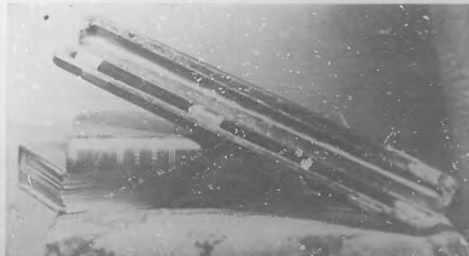
Magnífica hatuta, donada por la casa editora de Giralt é Hijo, que junto con un artístico diploma acuarela dibujada al pincel de Rodríguez Moroy, constituye el premio para el autor de la música del Himno que resulte premiada en el nuestro concurso.

Para mas detalles, dirigirse á la Administración de BOHEMIA, Habana 80.